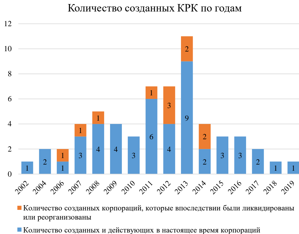
Рис. 1. Динамика российских РКР